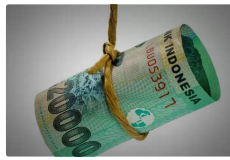
Trik unik ini akan berikan Anda keberhasilan dalam