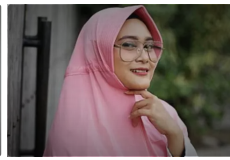
Pelajar Indonesia temukan cara pulihkan diabetes