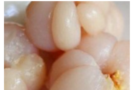
Seluruh negara kaget! Diabetes mudah diobati (lihat di sini)

Kontak / Tentang Kami / Radio / Loker / Timlo.tv / Timlo.info