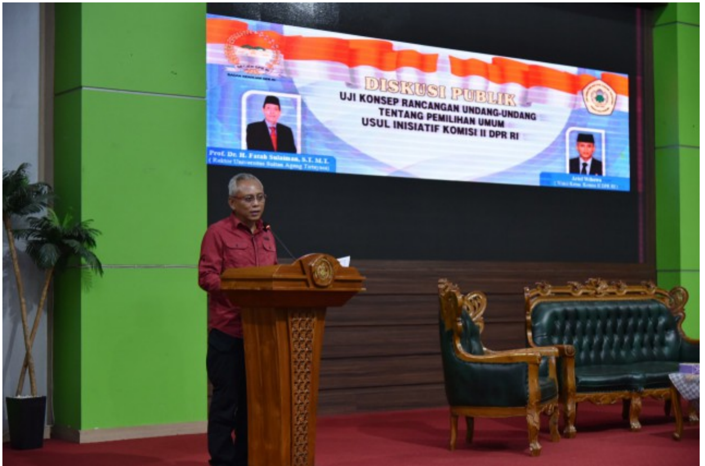
Wakil Ketua Komisi II DPR Arif Wibowo