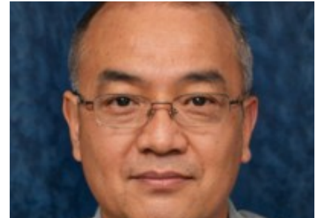
Pakar diabetes: "Lupakan insulin! Diabetes bisa diobati dengan produk biasa..."