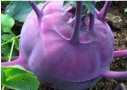
Diabetes hilang dalam 5 hari tanpa pil! Resep rahasia, baca sebelum dihapus!