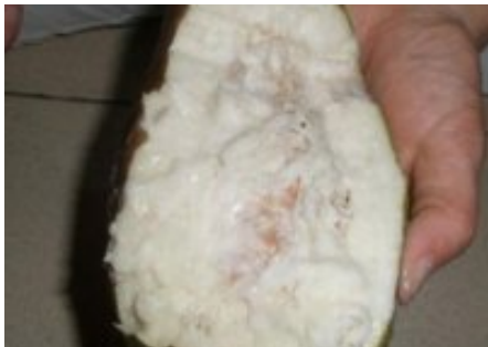
Diabetes akan hilang sekali dan untuk selamanya!