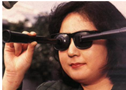
Ini adalah obat baru yang tingkatkan daya penglihatan 90 kali lipat!