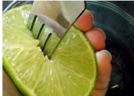
Musuh terbesar diabetes kini terungkap: ternyata sudah diketahui secara global...